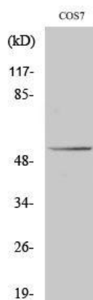
Western Blot analysis of COS7 cells using p53 Polyclonal Antibody

稀释比 WB: 1/500-1/2000 IHC: 1/100-1/300 IF: 1/200-1/1000 ELISA: 1/10000