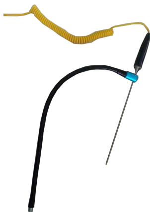
图1 温度计支撑套件及外置温控探头